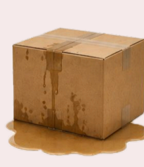
Płyny / sypkie luzem