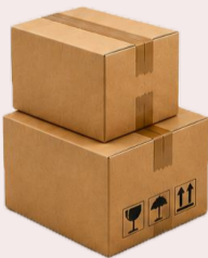
2+ części skleione