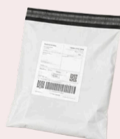
Foliopak > max 5 kg